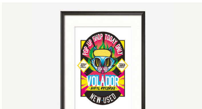
RÓTULOS Y CARTELES