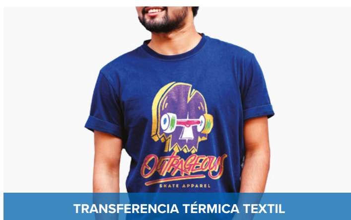
TRANSFERENCIA TÉRMICA TEXTIL